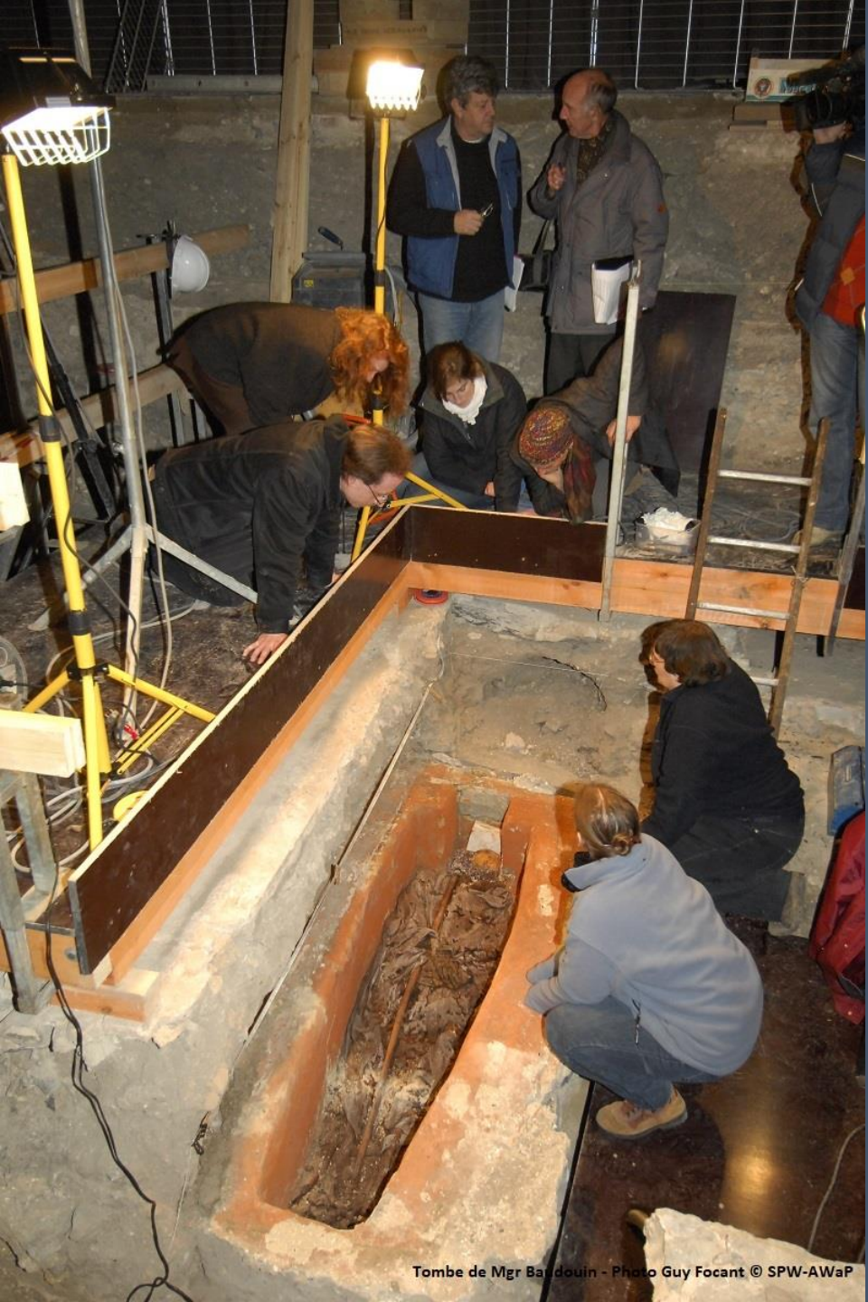
Tombe de Mgr Baldouin - Photo Guy Focant © SPW-AWaP